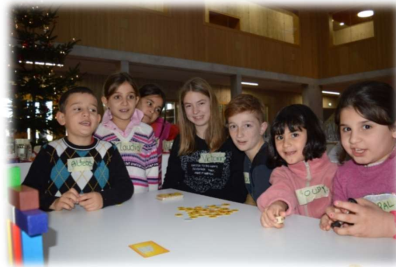
Adventsnachmittag mit Flüchtlingskindern

Lernen durch Engagement ist eine Lehr- und Sozialform, die gesellschaftliches Engagement von Schüler*innen mit fachlichem Lernen verbindet.